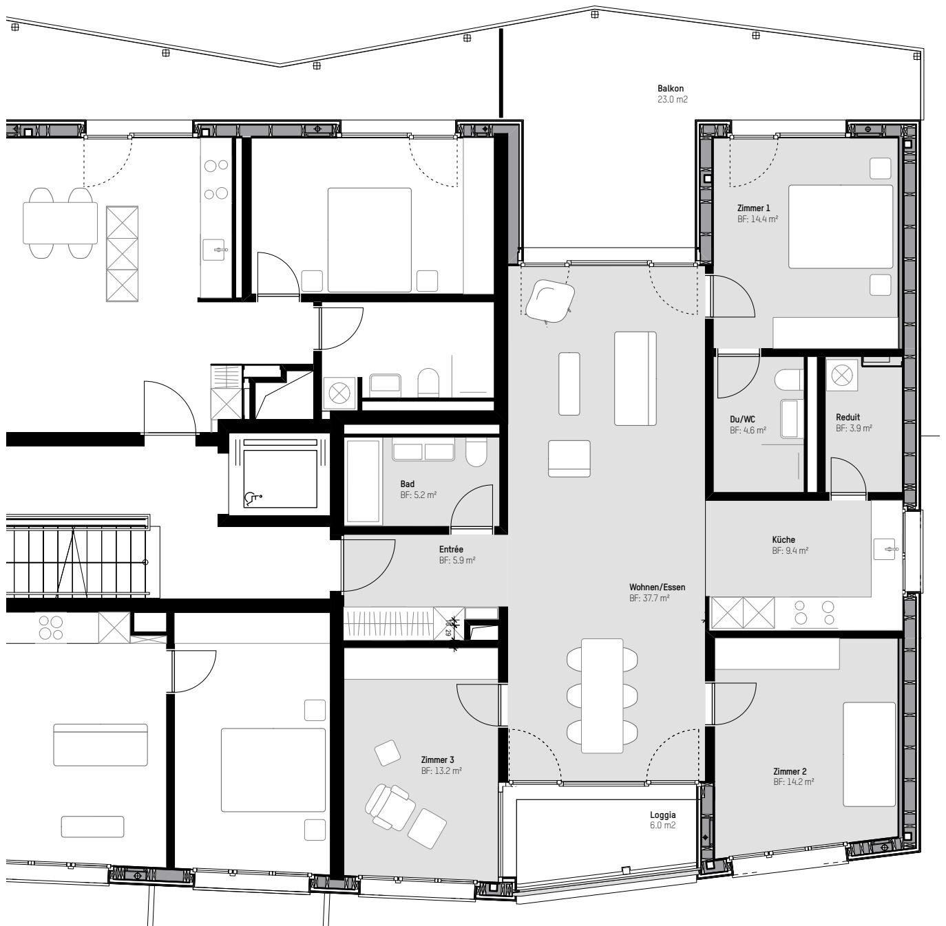
4.5 Zimmerwohnung Wohnfläche 108.4 m 2 (Innenkante Umfassungswände)