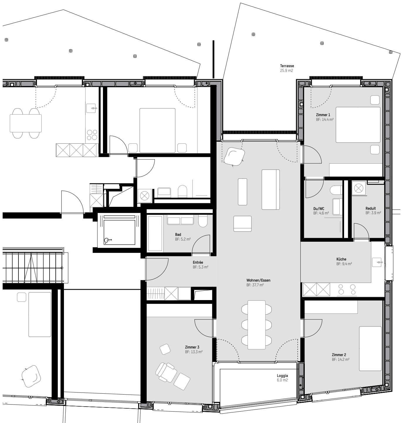
4.5 Zimmerwohnung Wohnfläche 107.9 m 2 (Innenkante Umfassungswände)